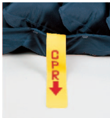
Fig. 1: Matratze mit Schnellentlüftung

Die Prozessorsteuerung reguliert und überwacht den Matratzendruck automatisch über das vom Anwender eingegebene Patientengewicht von 40 bis 160 kg .